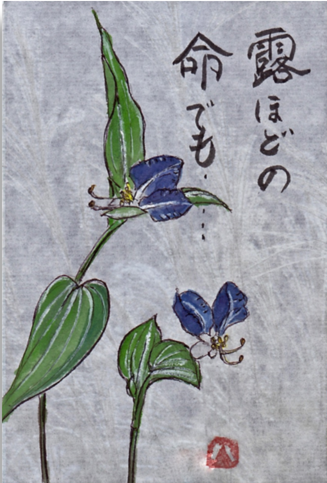
水彩画：ハナミズキさん