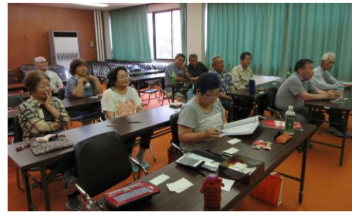
[6/27 カラオケ教室の様子]