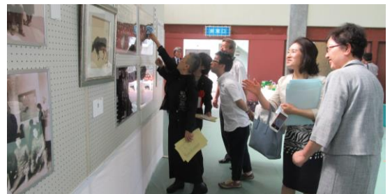
(左上：生誕地碑の除幕式 左下：遺作展テープカット 右上：記念の集い 右下：遺作展会場)