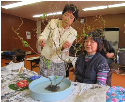
[第1回生け花教室の様子]