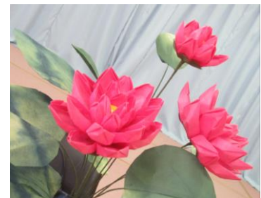
再度、挑戦中の蓮の花 [和紙折り紙教室]