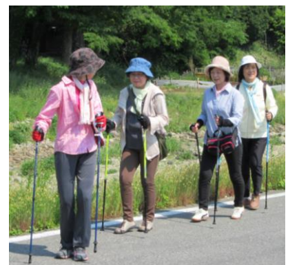
[ルディックウォーキング活動の様子]