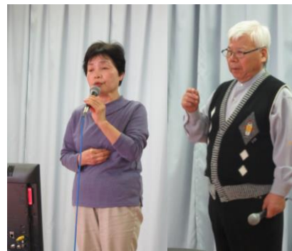
[4/25 カラオケ教室の様子]