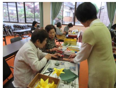
[5/9 和紙折り紙教室の様子]