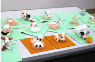
5/3 羊毛クラフト 牧場公園