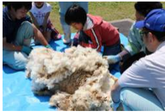
5/3.5.7 羊の毛刈り 牧場公園