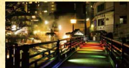
빛의 일류전 형형색색의 조명이 켜지는 거리 풍경은 낮과는 또 다른 분위기를 연출하기 때문에 낭만적인 추억을 만들 수 있습니다.