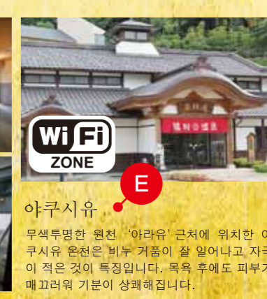
아라유 무색투명한 원천 '아라유' 근처에 위치한 야쿠시유 온천은 비누 거품이 잘 일어나고 자극이 적은 것이 특징입니다. 목욕 후에도 피부가 매끄러워 기분이 상쾌해집니다.