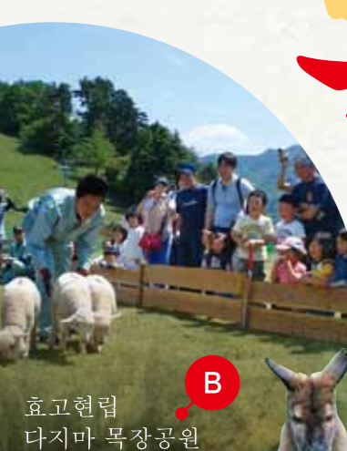
효고현립 다지마 목장공원

자연과 동물을 접할 수 있는 종합 레저 시설입니다. 공원내에는 '다지마 소 박물관'과 '작은 동물 사육장' 등도 있습니다. 식사와 숙박시설도 완비되어 있고 겨울에는 스키장도 문을 엽니다.