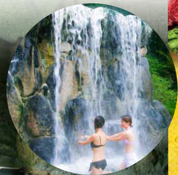
리프레시 파크 유무라 수영복을 입고 들어가는 온천 시설입니다.

유무라 온천을 중심으로 한 자연이 풍요로운 지역. 우에야마 고원에서 트레킹을 즐긴 후 유무라 온천에 들어가 피로를 풀어 보는 건 어떠십니까?