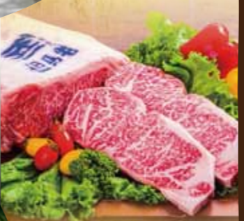
다지마 비프 레스토랑 '가에데' 다지마 비프 스테이크를 맛볼 수 있는 레스토랑. '침판구이' 스타일의 가게로, 사무라이를 연상시키는 셰프의 날렵한 손놀림을 보는 것도 또 다른 즐거움입니다. 스파시설 '리프레시 파크 유무라'와 같은 곳에 있습니다.