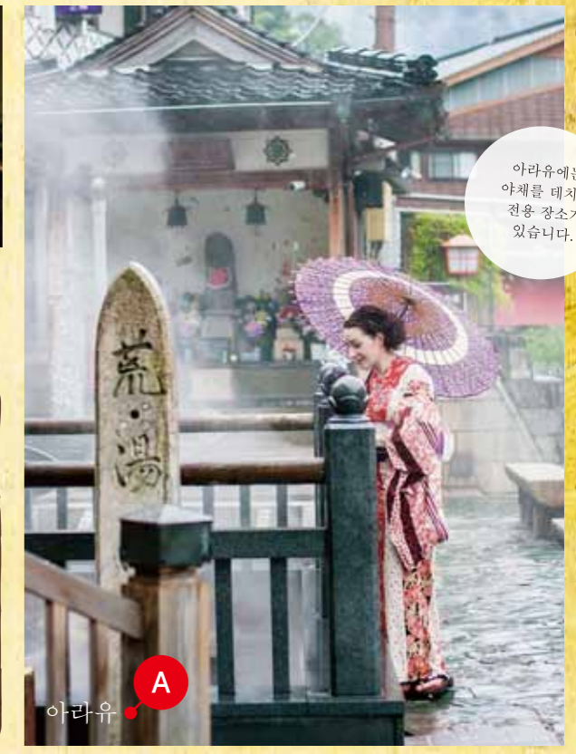
아라유에는 야채를 데치는 전용 장소가 있습니다.