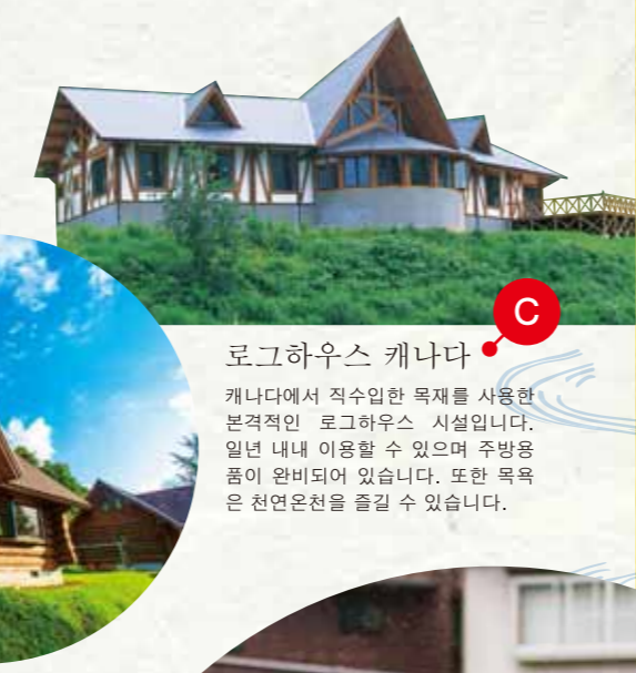
로그하우스 캐나다 캐나다에서 직수입한 목재를 사용한 본격적인 로그하우스 시설입니다. 일년 내내 이용할 수 있으며 주방용품이 완비되어 있습니다. 또한 목욕은 천연온천을 즐길 수 있습니다.