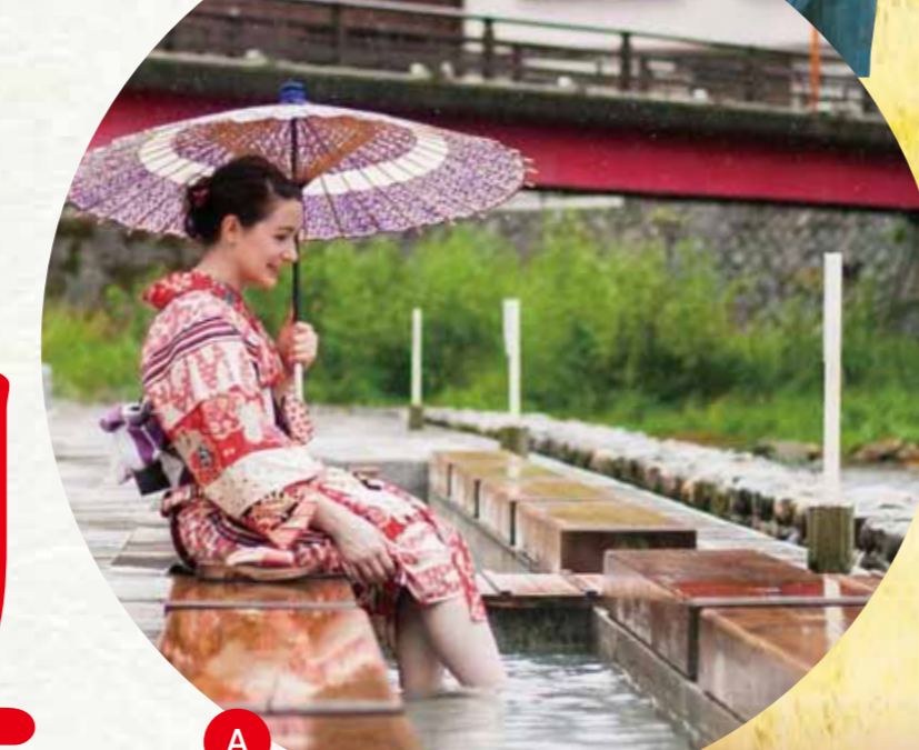
족탕 아라유 바로 옆, 하루키가와 강을 따라서 정비된 시원하게 트인 공간에서 즐기는 족탕입니다. 【무휴】