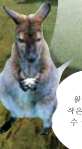
활라비 같은 작은 동물과 놀 수 있습니다.

자연과 동물을 접할 수 있는 종합 레저 시설입니다. 공원내에는 '다지마 소 박물관'과 '작은 동물 사육장' 등도 있습니다. 식사와 숙박시설도 완비되어 있고 겨울에는 스키장도 문을 엽니다.