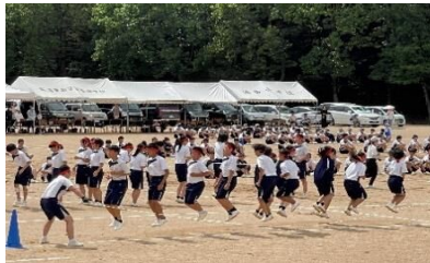
浜中全校生徒による大縄飛び

9月になっても猛暑が収まりませんが、町内の中・小学校で秋季運動会が開催されました。9日(土)は浜坂中学の運動会でコロナの緩和により久しぶりに多く観客が訪れ、生徒の力強い