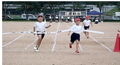
浜坂東小1年生の徒競走

演技に歓声が沸きました。23日(土)は浜坂東小学校の運動会でした。全校生36人と小規模ながら、それぞれの素晴らしい演技に感動しました。少し涼しくなったとはいえ、日なたはまだ暑く、途中で休憩タイムを入れたり、午前中で演技を終えるなど、熱中症への配慮もありました。