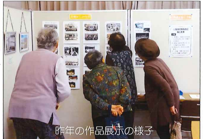
昨年の作品展示の様子