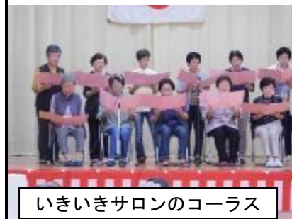
いきいきサロンのコーラス

居組区の主催で、9月18日(月;敬老の日)に居組地区敬老会が75歳以上の高齢者、結ぶ会会員を対象として開催されました。2年間はコロナで中止、昨年は台風で中止となり、4年振りの開催となりました。今年は昼食なしで弁当の持ち帰りとなりました。午前中の開催でした。区長、来賓のあいさつの後、結ぶ会やいきいきサロン、若手有志による踊りやコーラス、カラオケ、ダンスなどにより敬老会を盛り上げました。最後にビンゴゲームをして終了して楽しい一時を過ごしました。