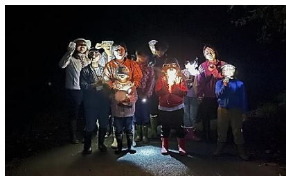
恒例のお化け集合写真

昼間の猛暑を忘れさせてくれる秋の夜長、楽しい時間は短く、あっという間に9時の閉会時間です。夜も面白いよ～！