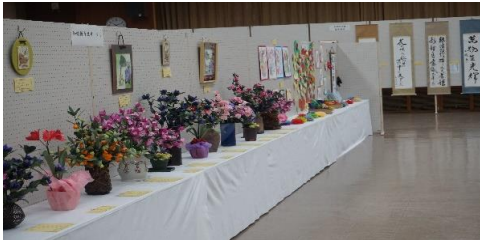
(この様な感じで展示)

《4振りの開催です。公民館だより 10月号で詳しく募集します》 開催日 11月25日(土) ～ 11月26日(日) 開催場所 浜坂南小学校 体育館 募集展示物 絵画・手芸品・工芸品 詩歌・書・写真・生け花 和紙ちぎり絵・和紙折り紙 等 展示を出来るもの全てが対象です