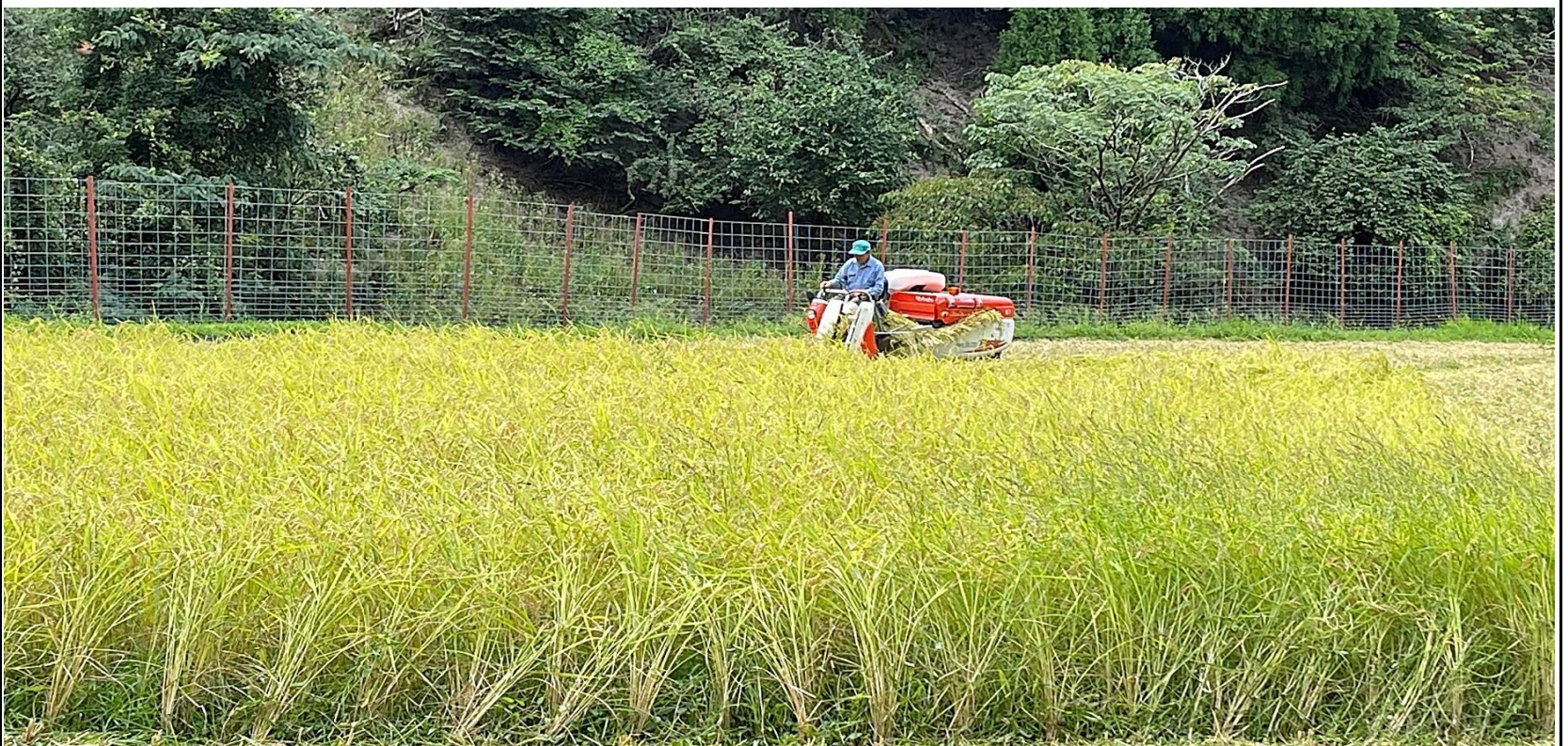
今年は例年より早く、8月終りには稲刈りが始まった(2023年8月30日)。