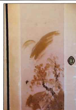
← 本堂にある襖絵 義厚住職に宛てた手紙