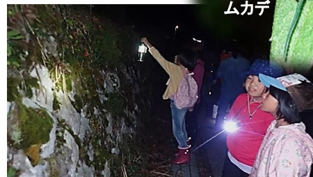
石垣の間から鳴いている虫を探す