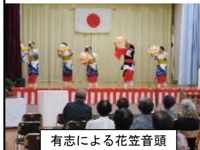
有志による花笠音頭