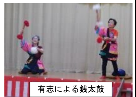
有志による銭太鼓