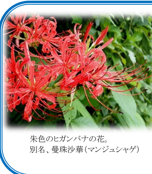
朱色のヒガンバナの花。別名、曼珠沙華(マンジュシャゲ)

今月の野草 ヒガンバナ 秋の彼岸の頃に花が咲き、野辺を鮮やかな朱に染めることから、この名前が付けられています。 地中に球根があり、毒があるので、猪が掘り返さないのとこどで、土手や畦に移植されることもあります。元から日本にあった野草ではなく、中国原産の帰化植物です。