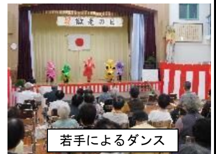
若手によるダンス