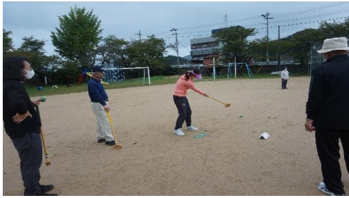
写真は昨年の様子 です。 今年もたくさんの方々に参加を お願い致します。