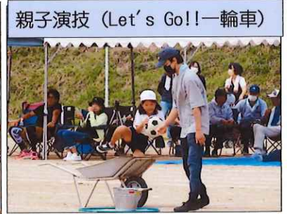
親子演技 (Let's Go!!一輪車)