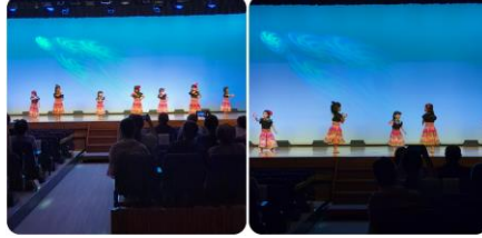
ステージでのダンスは初めてで緊張をお姉さんが和らげてくれました