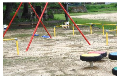
旧幼稚園に完成した遊具、小さなお子様と一緒にどうぞ

10月中旬頃 13:30～集会室 参加費無料(土、日に予定) 26(土) 8:30～10:00 集会室 28(月) 13:30～集会室