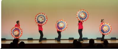
やまざくらも練習の成果を披露しました