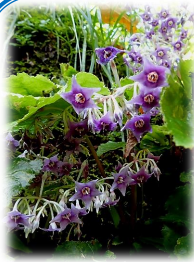
青く星形をしたイワタバコの花

兵庫県県民生活部 男女青少年課 神戸市中央区下山手通5-10-1 TEL078-341-7711 (内線2798)