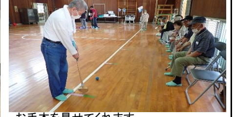
お手本を見せてくれます