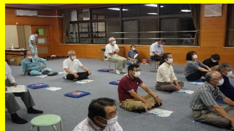
昨年の参加者の皆さんです