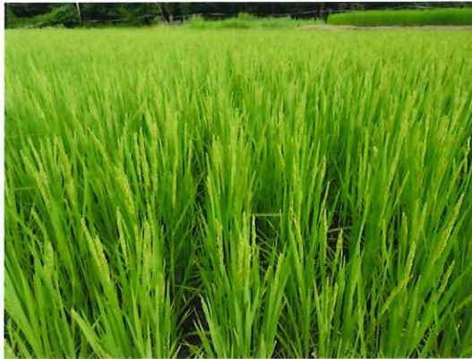
大きく生長して穂が見られるようになった稲（7月14日）

毎年8月16日に行われていたこの事業ですが今年は「より多くの皆さんに参加していただけるように」と休日の開催となりました。（詳しくは「八田文化交流会」より配布されている案内チラシをご覧ください。）