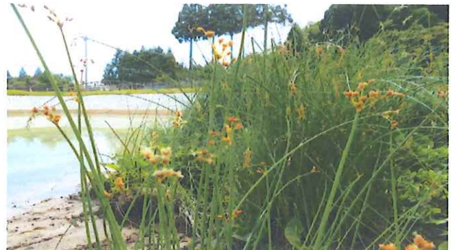
池に水を張るまでの風景。ウッドデッキと河骨(こうほね) 太藺(ふとい)