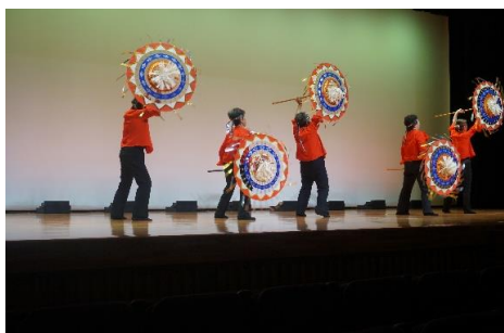
三尾山桜の皆さんです