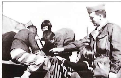
ギブミーチョコレートは有名ですよ