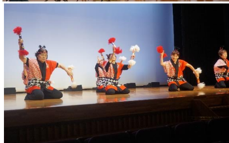
諸寄山吹会のみなさんです