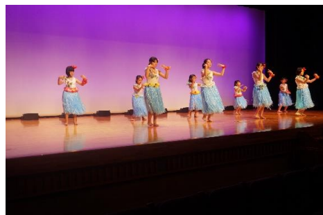
文化協会 初めての子供協会員 プリメリアのみなさんです