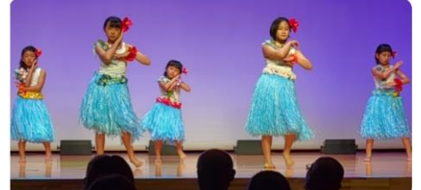
流石プルメリアのお姉さんの息の合ったダンスで会場を魅了しました