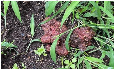
トマトを食べたハクビシンの糞