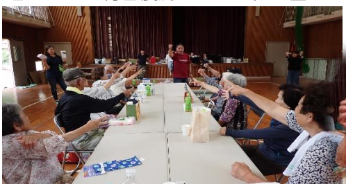
ゲームの賞品もらって笑顔