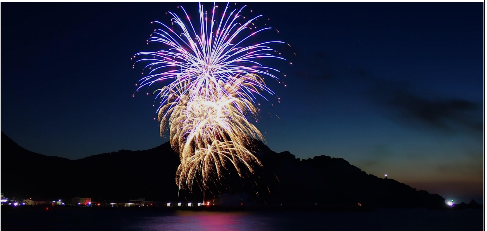
城山を背景に、夏の夜空を彩る川下祭りの花火(2023年7月16日)。

【夏だ！花火だ！「浜坂ふるさと夏祭り花火大会」】 コロナの影響で途絶えていた年もありましたが、昨年に引き続いて今年も川下祭りの中日、16日の午後8時から花火大会が開催され、約3,000発の花火が打上げられました。週末と海の日を加えた3連休は真夏の天気となり、花火が始まる前の夕焼けも綺麗でした。約5万人の観客が訪れ、100以上の屋台が並んだ浜坂サンビーチは大賑わいでした。夜空を彩る花火が海に映え、とても見応えがしました。