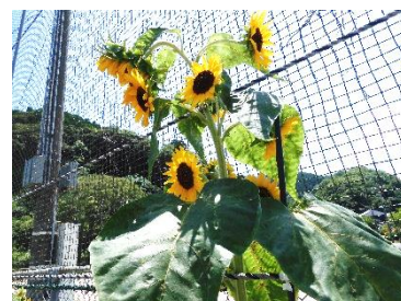
グラウンド前に咲くひまわりも元気に！

(毎週火・木・土・日)8:30～グラウンド 5・12・19・26(土) 15:00～研修室 22・29(火) 13:30～研修室 5(土) 13:30～集会室 8月上旬予定