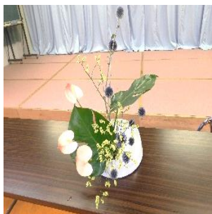
完成した、7月の作品