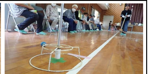
みんなが声援、グランドゴルフ