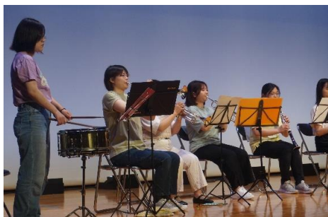
左の写真 オープニングセレモニー を飾ったスパパラダイス・ ウインドオーケストラの の皆さんです

でも、オープニングセレモニーを務めて戴いたグループ、そして子供たちのフラダンス、銭太鼓、傘踊り 等々 プログラムが進むに連れて舞台と客席が熱を帯び、一体感を感じました。