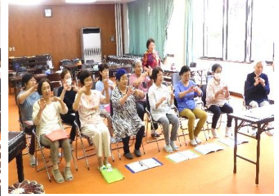
声を出しながら手と足を使う しぐさに皆さん挑戦です。