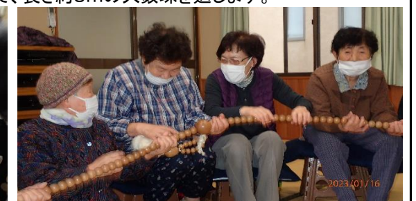
膝の痛いのも良くな〜れ