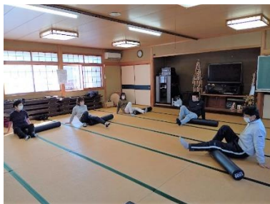
ストレッチ教室(1月23日)

幼児期に運動習慣を身に付けると、身体の諸機能の発達が促されることで、健康的な生活習慣の形成に役立つようです。