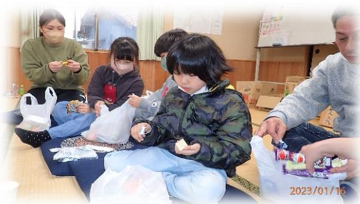
休憩にはおやつがもらえます