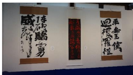
高校生の臨書作品は元気一杯です