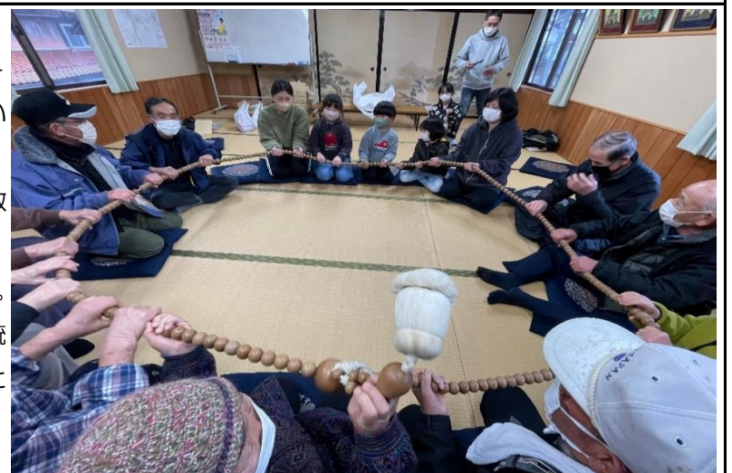
みんな輪になって、長さ約8mの大数珠を廻します。

「じゅ〜ずくりなんまだ〜〇〇〇の頭をはりとばせ〜」鐘を叩いて調子をとって、そんなかけ声を唱えながら、みんなで車座になって太くて長い数珠を回します。房が廻ってくると膝や肩、頭など、体の悪いところや痛い場所に当てて、良くなるようにをお願いします。そんな、地区に残る『数珠繰り』の風習が、16日、久斗山ふれあいセンターで行われました。子どもが少なくなって、地区の家々を廻らなくなって4年目になります。今年集まったのは19人、そのうち子どもは4人だけでした。地域の伝統行事も少子高齢化で今や失われつつあります。数珠繰りも、この先あと何年開催できるか…大数珠を回しながら合間に休憩を挟み、飲み物やおやつが振る舞われて、みんな楽しい時間を過ごしました。