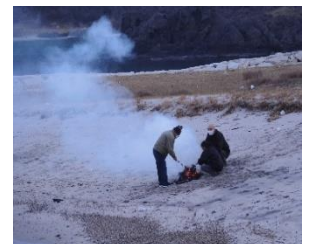
[1/7 午前7時頃各町内 とんど の焚き上げ風景]