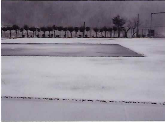
久しぶりの積雪（八田防災広場）