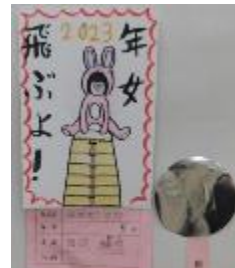
田邊瑞悠さん作品