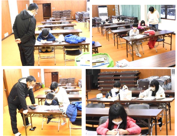
12/24 寒い一日ですが、熱心に取り組む子供たち。