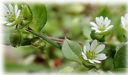
コハコベの花。 ハコベの仲間によく似たものが何種類かあって、見分けるのが難しい。 コハコベは茎が暗紫色をしている。