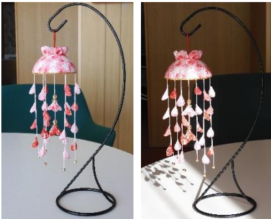
つるし飾りに挑戦です。