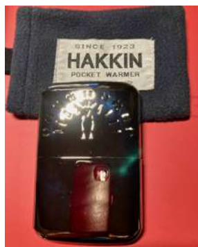
小さいけれど暖かい ハクキンカイロ mini

お正月は拍子抜けするほどの良いお天気が続きましたが、現在寒波が近づいており、この便りが届く頃は一年で最も気温の低い日になるらしいです。現在、体の方も凍結しそうなほど気温の低下を体感しています。近頃、体の芯から冷え切っていることが多く、使い捨てカイロの出番が増えていくのですが、毎回ゴミになることに罪悪感を感じ「ハクキンカイロ"ミニ"」を購入しました。そういえば、祖父が普通サイズを使っていたのを思い出しました。