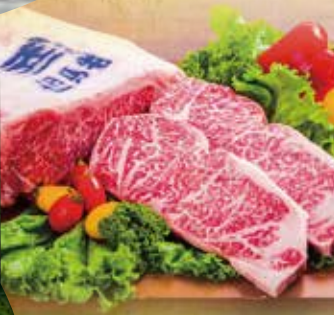
ร้านอาหารจากเนื้อวัวทาจิมะ "คาอเดะ" ร้านอาหารที่สามารถลิ้มรสเนื้อวัวทาจิมะ บ้านสไตล์ "กระทะร้อน (เทปายากิ)" สามารถเพลิดเพลินไปกับเชฟอาหารที่มีฝีมือเช่นชาบูไร "รีเฟรชพาร์ค ยูมูระ" แหล่งพักผ่อนแนวสปา