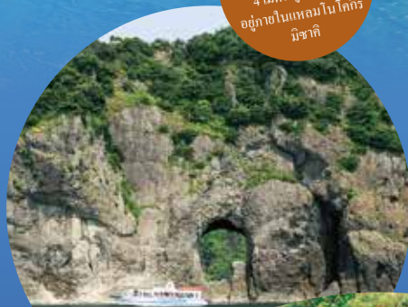
อาซาบิโคมอน (ประตูอาซาบิโค)

ปากถ้ำที่เกิดจากหินตะกอน ภูเขาไฟขนาดความกว้าง 4 เมตร สูง 8 เมตร อยู่ภายในแหลมโนโคโนอิ มึซากิ