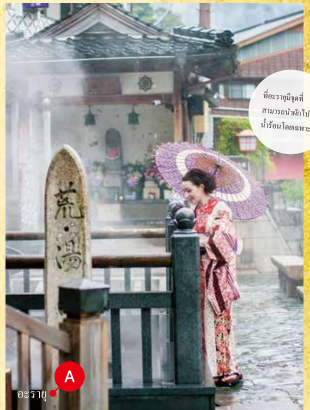
ที่อะราชิมิจุดที่ สามารถนำทักไปดื่ม น้ำร้อน โดยเฉพาะได้