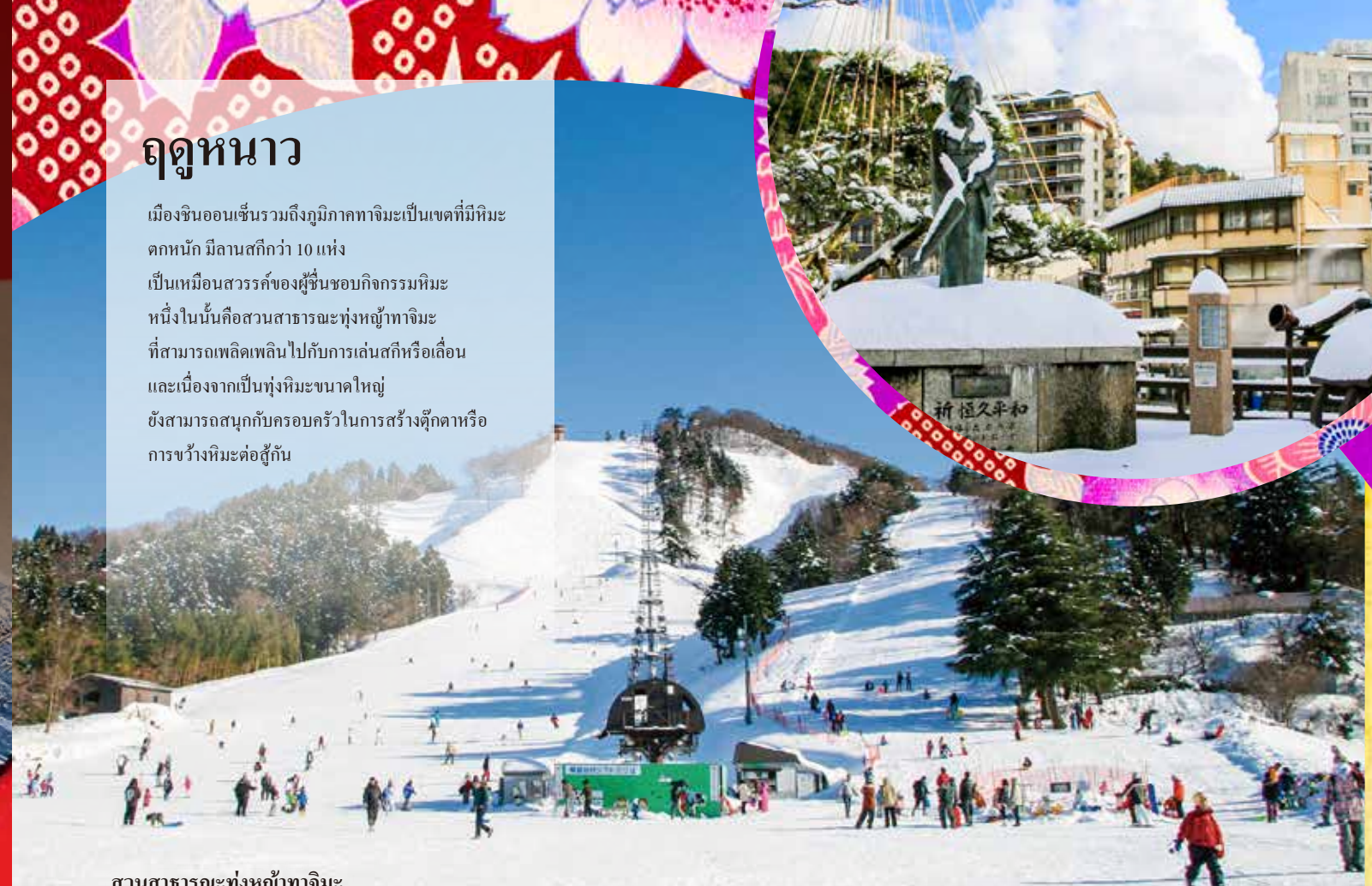
สวนสาธารณะทุ่งหญ้าทาจิมะ

เมืองชินอนเซ็นรวมถึงภูมิภาคทาจิมะเป็นเขตที่มีหิมะ ตกหนัก มีลานสกีกว่า 10 แห่ง เป็นเหมือนสวรรค์ของผู้ชื่นชอบกิจกรรมหิมะ หนึ่งในนั้นคือสวนสาธารณะทุ่งหญ้าทาจิมะ ที่สามารถเพลิดเพลินไปกับการเล่นสกีหรือเลื่อน และเนื่องจากเป็นทุ่งหิมะขนาดใหญ่ ยังสามารถสนุกกับครอบครัวในการสร้างตุ๊กตาหิมะหรือ การขั้วหิมะต่อสู้กัน