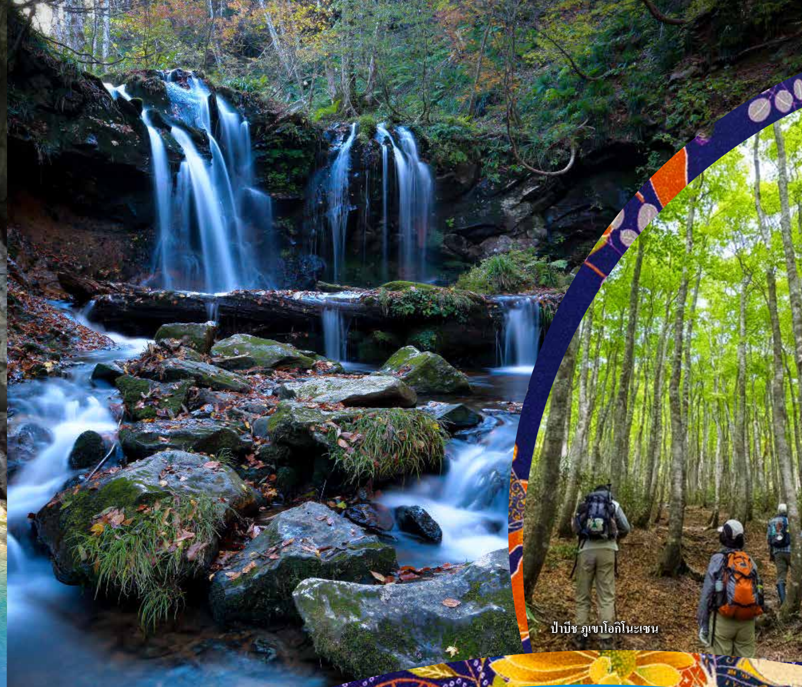
น้ำตกซารุโอะ