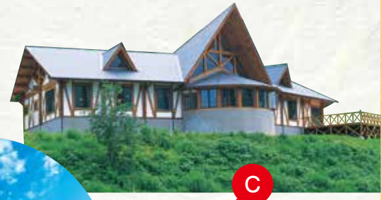
บ้านไม้แคนาดา บ้านไม้ที่สร้างจากไม้เนื้อแข็งจากแคนาดา ห้องครัวมีอุปกรณ์พร้อมสรรพ สามารถให้บริการได้ตลอดทั้งปี และมีอ่างอาบน้ำที่มีน้ำร้อนจากธรรมชาติ