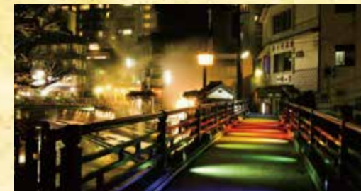
การแสดงของแสงไฟ ถนนเลียบเมืองที่มีสีสันจากแสงไฟที่ประดับอย่างสวยงาม ให้บรรยากาศที่แตกต่างกัน สามารถทำให้ความทรงจำที่แสนโรแมนติก