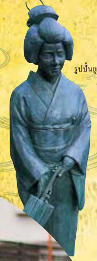
รูปปั้นซุเมอิโอะ