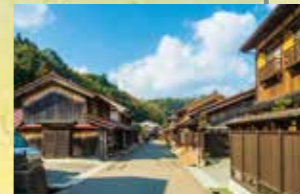
I 지즈슈쿠 역참마을 · 이타이바라