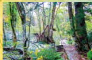
G 다지마 고원 식물원

Plan A Plan B 뿔 표지 모델 코스의 루트를 표시하고 있습니다.