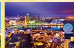
L 고베의 야경