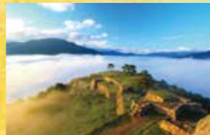
H 다케타 성터