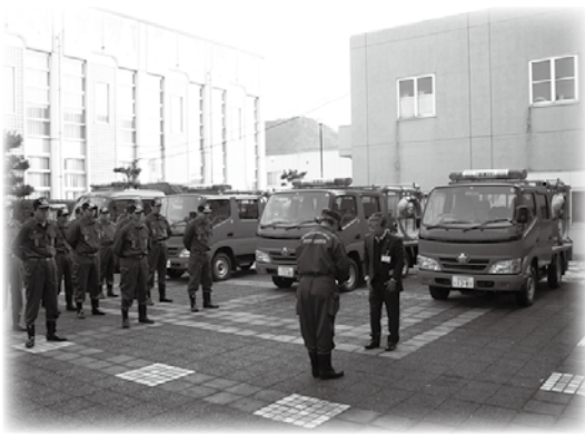
▲新しく配備されたポンプ車等

今回の更新は、いずれも20年以上使用してきた車両の老朽化に伴うものです。ポンプ車は従来までの乗車定員が5人から10人になり、一度に多くの団員が火災現場などに駆けつけることができず。また、運転操作やポンプ操作が容易になり迅速な消火活動が期待できます。