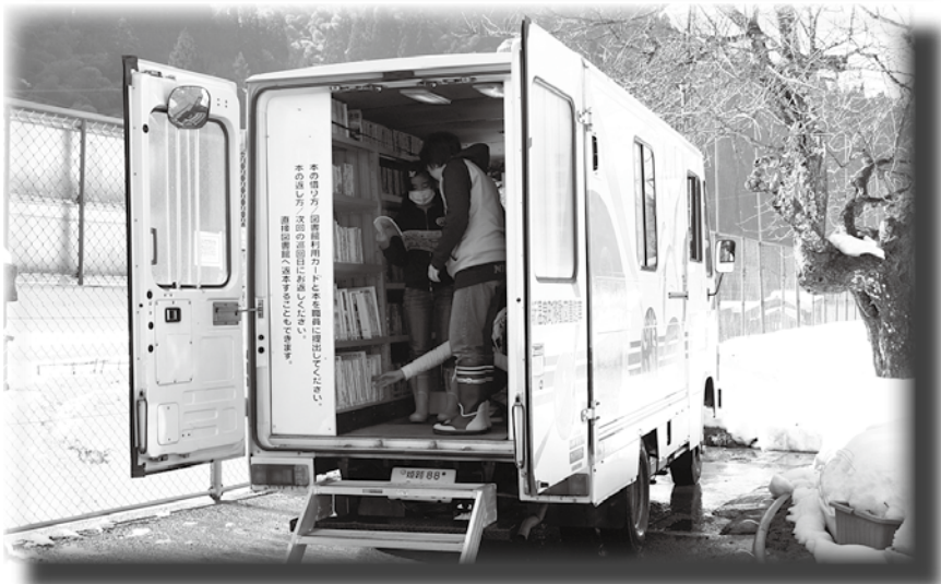
移動図書館車「ささゆり号」

移動図書館車「ささゆり号」は、図書館を利用しにくい地域の住民などに生涯学習の場を提供するため、合併前の平成4年9月から運行を続けています。ささゆり号は動く生涯学習センターとしての機能と地域と町をつなぐ役割を担っています。