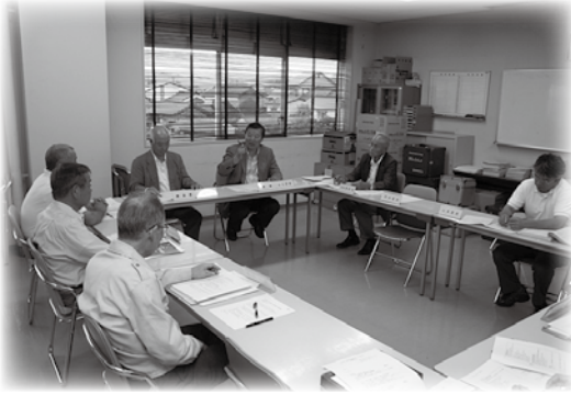
▲協働まちづくり委員会の様子