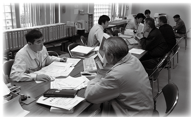
▲昨年の申告相談の様子