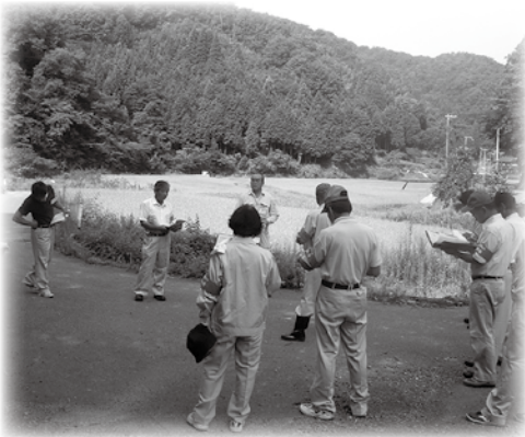
▲農地パトロールの様子