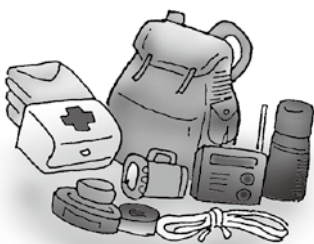
▲懐中電灯や食料品、飲料水、衣料など