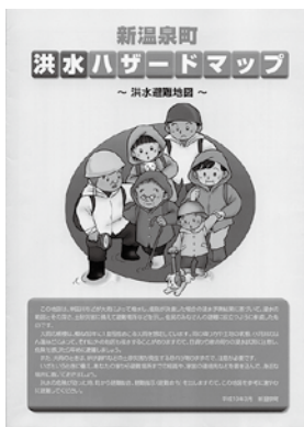
▲洪水ハザードマップ

※身体に障害がある人など避難に時間がかかる人は、避難準備の段階で早めに避難するようにしましょう。