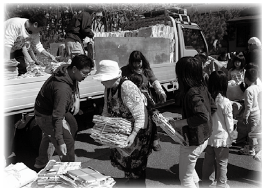
▲子ども会による資源回収