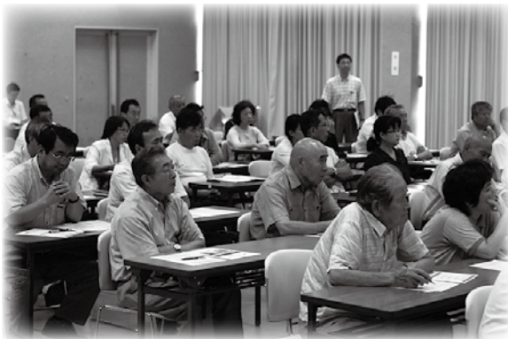
▲真剣なまなざしで講演に聴き入る聴講者

するために、地域情報に重点を置き、さまざまな工夫を凝らした取り組みを行っている模様の紹介が大変印象的でした。その一端を紹介すると、