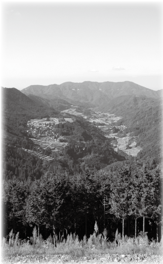
▲健全で豊かな森林を創造しましょう