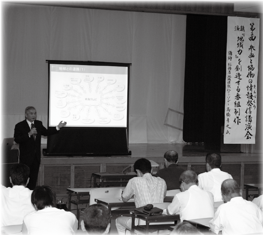
▲第2回「参画と協働の情報発信講演会」の様子