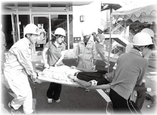
▲昨年の総合防災訓練

戦後最大の被害をもたらした平成7年の阪神・淡路大震災。また、今年8月の台風9号による兵庫県内の被害など、近年の自然災害は過去にない大規模で局所的な被害を起こしています。日本は、その地形や地質の特性から、地震や大雨などの自然災害が発生しやすい国であると言われていています。9月に入り、大雨や強風を伴い広範囲に被害をもたらす台風が多く発生する時期となりました。この機会にもう一度、災害が起きた時に自分の身を守るための行動について考えてみませんか。