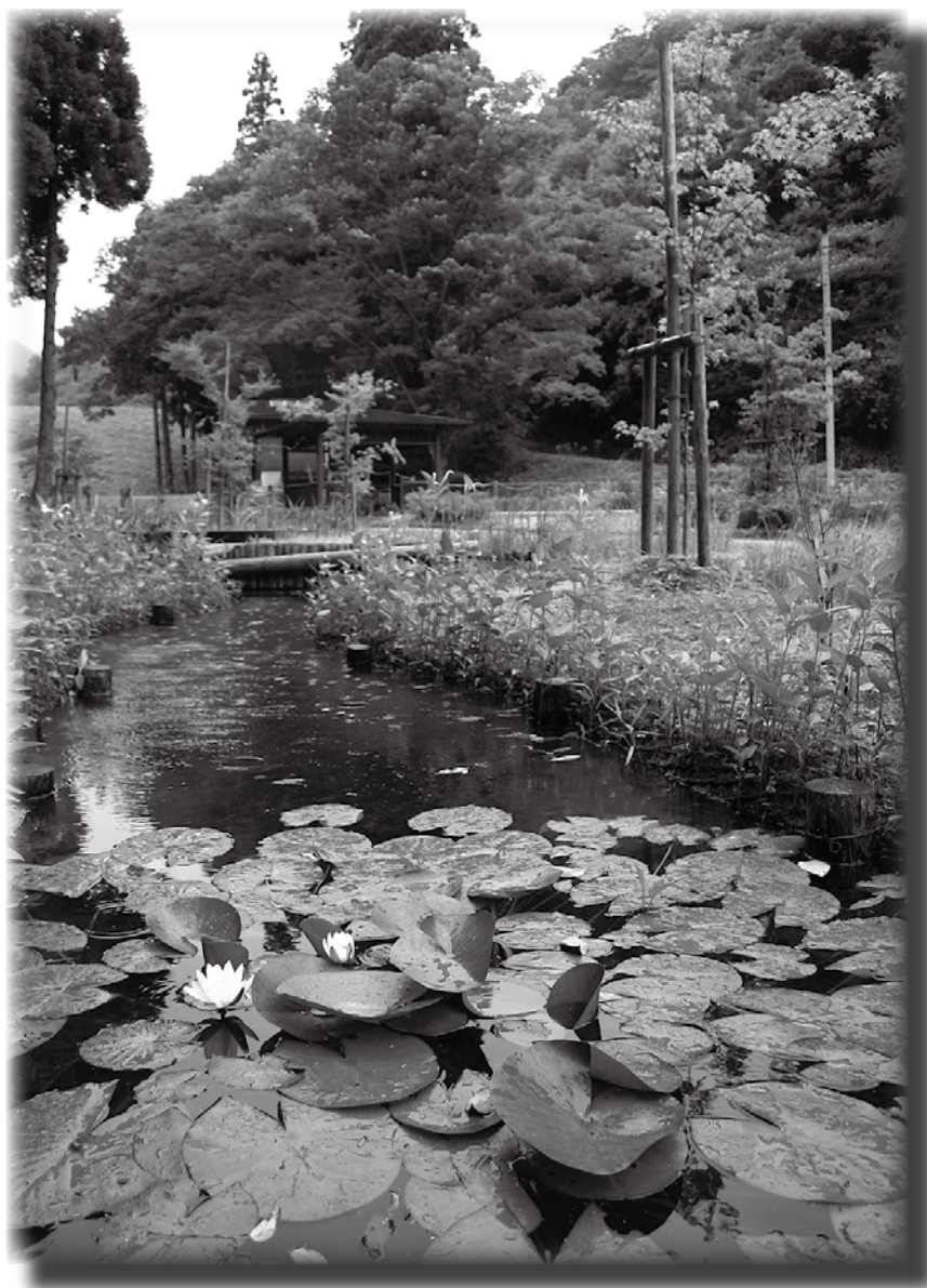
正法庵とんぼの里公園