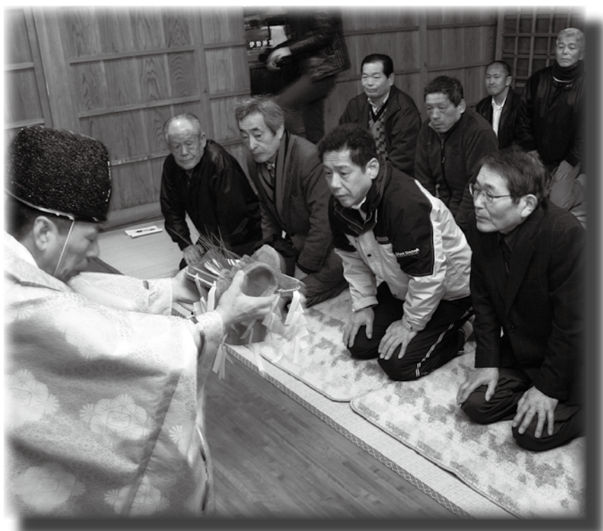
ミョウガを見て吉凶を占う参拝者

まだ夜が明けきらない午前6時、ミョウガの成長状況でその年の吉凶状況を占う神事「お茗荷祭り」が、2月11日（水）、新温泉町竹田の面沼神社（安藤隆広宮司）で行われました。