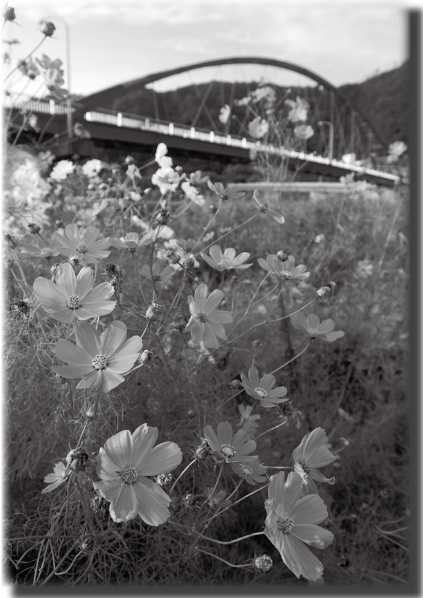
一面に咲き誇る白やピンクのコスモス