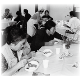
多くの人でにぎわう「味わいコーナー」