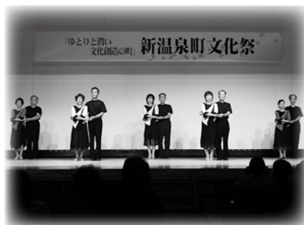
昨年の舞台発表の様子