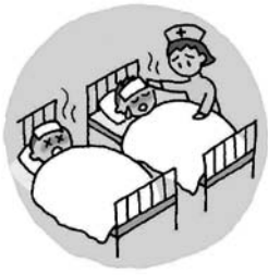
熱帯性感染症の流行

地球の平均気温が2℃上昇した場合、日本にも下記のような影響が現れると予測されています。日本の社会基盤、人間の健康、農業、自然生態系などに取り返しのつかない悪影響を及ぼす可能性があります。