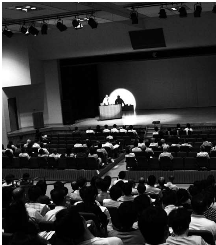
昨年夢ホールで行われた「人権を考える集い」