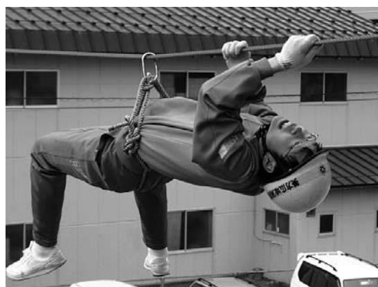
▲渡過訓練に取り組むトライやる生(撮影 宇野 由起信)

5月30日(金)に取材に訪れた美方広域消防本部では浜坂中学校生7人、夢が丘中学校生3人の計10人の生徒が活動していました。10人の生徒はロープを渡る渡過訓練、降りる降下訓練を消防署職員の指導の下、緊張した面持ちで真剣に取り組んでいました。この厳しい訓練を怪我なく安全に進めるため、大きな掛け声で安全確認を行っていました。