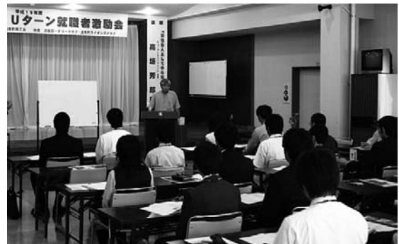
昨年の就職者激励会

新しく就職された新規学卒者及びUターン・転入者が、新社会人として地元で夢と希望を持って働き、将来、地域の大きな担い手として活躍していただくため、就職者激励会を開催します。情報交換、交流の場として、お気軽にご参加ください。