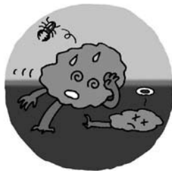
ブナ林の減少など 生態系の急変