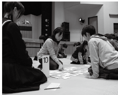
青少年新春かるた大会