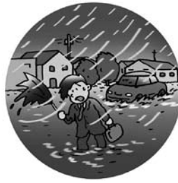
台風の雨量や 豪雨が増加