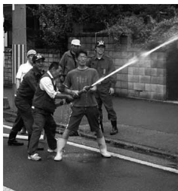
自主防災会による消火訓練

出火時において、消防署や消防団が到着するまで、迅速に初期消火ができるように消火栓器具の点検と操作訓練をしましょう。消火栓の使い方やホースの伸ばし方などを地域の皆さんが知っておくことで消火活動が実施でき、早期消火や類焼防止など被害を最小限に止めることができます。