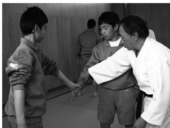
▲逮捕術を学ぶ生徒ら

5月29日(木)に訪れた美方警察署では、浜坂中学校生4人が逮捕術を学んでいました。生徒は構えや、前突き、前蹴りなど基本となるものから、実際に犯人がいることを想定した、難易度の高い技を真剣に、ときに楽しく取り組んでいました。