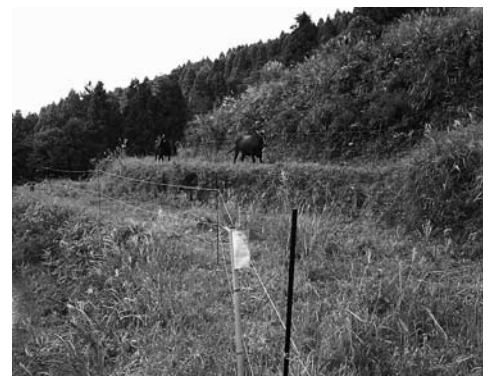
丹土地区での放牧の様子

丹土集落の鶴谷放牧組合では、平成16年度から始めた放牧で遊休農地を守っています。当初は70aに母牛を数頭放牧していましたが、予想以上に農地の保全効果が高いくことから、年々面積が増えていき、平成19年度は130aに拡大しています。さらに今年は、200aで放牧が行われる予定になっております。但馬牛が農地と農村地域を守っています。