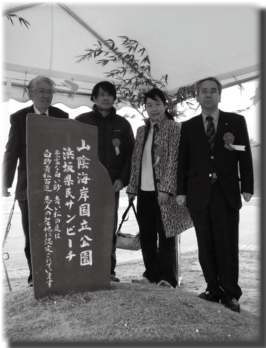
美しい山陰海岸を背景に設置された 記念モニュメント

愛を誓い合い、プロポーズするのにふさわしい観光スポット100カ所を選定する「恋人の聖地」プロジェクトで、浜坂県民サンビーチ帯が認定され、3月20日（木）、浜坂県民サンビーチで記念モニュメントの除幕式が行われました。