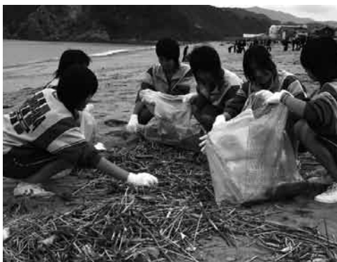
▲高校生による清掃活動

（財）但馬ふるさとづくり協会 TEL (0796) 24・2247 若しくは企画課 企画政策係 TEL (0796) 82・5624