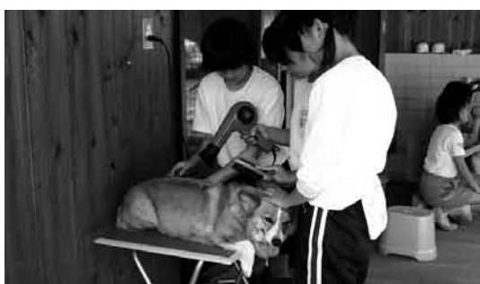
▲ドライヤーを使って毛を乾かす生徒ら

合併により、トライやる・ウィークの活動場所も浜坂、温泉両地域の相互交流が出来るようになりました。その中で全国的にも珍しい「ワンニャン夢ハウス」に取材に行きました。ワンニャン夢ハウスは今年4月にオープンした施設で、ペット(犬、猫)の温泉入浴(シャンプー)や一時預かり、宿泊などが出来る施設です。