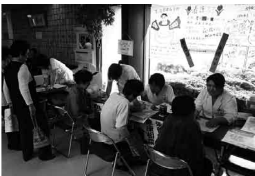
▲来院者に健康相談などを行う看護師ら

同フェアは地域住民と看護師とのふれあいの機会をつくろうと、毎年行っているものです。今年も「いつでも、どこでも、誰にでもやさしい看護を」をテーマに、玄関ホールに設置された特設コーナーで、看護師や管理栄養士などによる健康相談や血圧測定などが行われました。