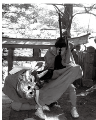
栃谷田君麒麟獅子舞